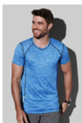
ST8840 Recycled Sports-T Reflect